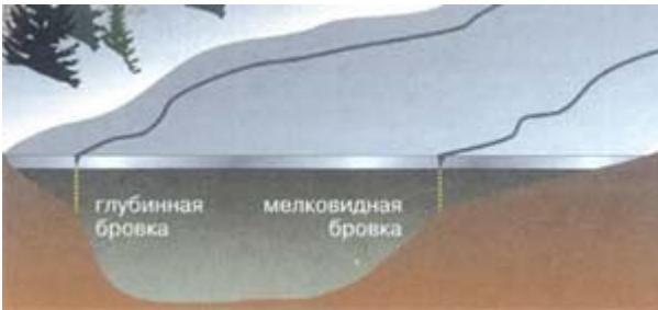
Рис.2. Образование первичных трещин в местах стыковки льда с различной толщиной.

Думается, практический интерес будет представлять примерный суточный ход прироста льда в зависимости от температуры воздуха и уже имеющейся его толщины. Такие данные сведены в таблицу, они позволяют прогнозировать состояние льда накануне выхода на рыбалку. Это, конечно, идеальная картина, не учитывающая снежного покрова на поверхности льда. Известно, что теплопроводность (в данном случае – холодопроводность) снега до 30 раз меньше, чем у льда (все зависит от рыхлости снега), поэтому при снегопадах надо вносить в расчеты соответствующую поправку.