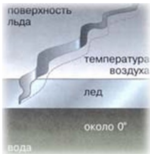
Рис.1. Разлом на поверхности льда, вызванный его температурной деформацией.

Прочность ледяного покрова линейно увеличивается с ростом толщины льда и с понижением его температуры, однако температура льда по толщине различна: сверху она равна атмосферной, а внизу – соответствует точке замерзания воды, то есть около 0^{\circ} . А поскольку температурный коэффициент линейного расширения льда огромен (например, в пять раз больше, чем у железа) и всем известно, как разрываются прочные сосуды с замерзшей водой, то становится понятно, что аналогичные процессы сопровождают ледяной покров по мере роста его толщины: имеющие разную температуру слои испытывают расширяющие нагрузки как поперечного, так и продольного направления. Именно поэтому при значительных морозах лед лопается с оглушительным, "пушечным" грохотом, и по нему разбегаются длинные трещины, имеющие замысловатую форму (рис.1).