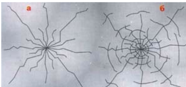
Рис.4. Типы растрескиваний льда под нагрузкой: а - радиальные трещины, не ведущие к провалу груза; б - радиальные трещины, сопровождаемые концентрическими разрушениями, ведут к быстрому провалу груза.

прогибе его в 5 см трещин на нем не образуется; прогиб в 9 см ведет к усиленному образованию трещин, прогиб в 12 см вызывает сквозное растрескивание, при 15 см лед проваливается. Трещины под действием нагрузок возникают двух типов: радиальные (рис.4-а) и концентрические (рис.4-б).